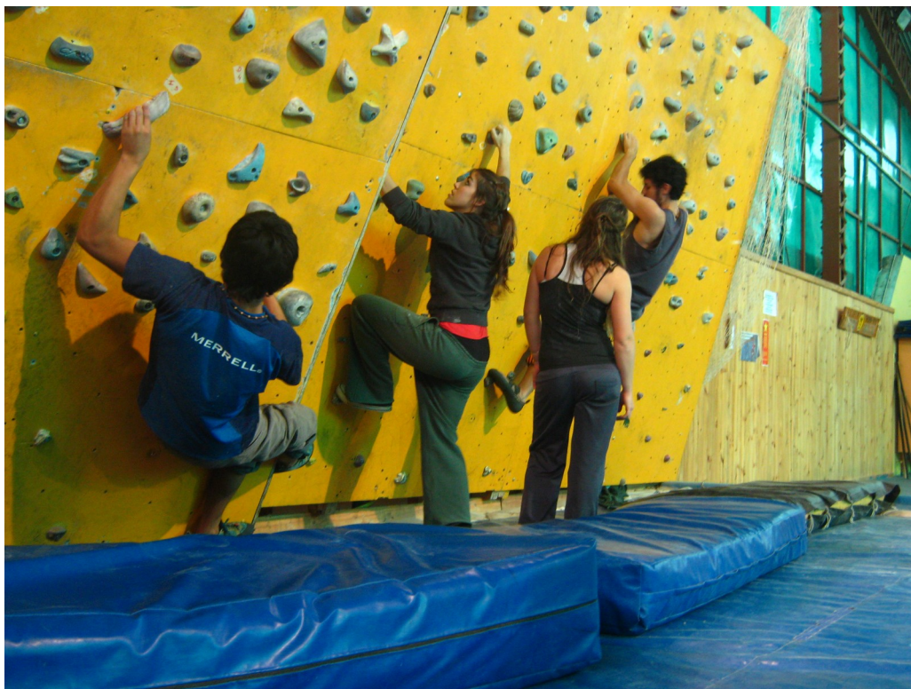
Figura 3. DRE 1, mini muro del Club Los Pehuenes, Bariloche.

En el marco del Profesorado en Educación Física algunos estudiantes avanzados, a partir de una actitud colaborativa y solidaria, disponían de sus saberes a modo de estrategia docente hacia sus pares, anticipando y ejerciendo el rol docente con aquellos que presentaban algunas dificultades.